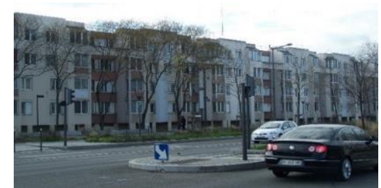
Bâtiment I Façade de l'avenue Mermoz