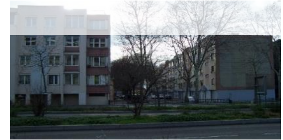
Bâtiments I&O Vue de l'avenue Mermoz