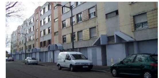
Bâtiment O Rue Morel/Avenue Mermoz