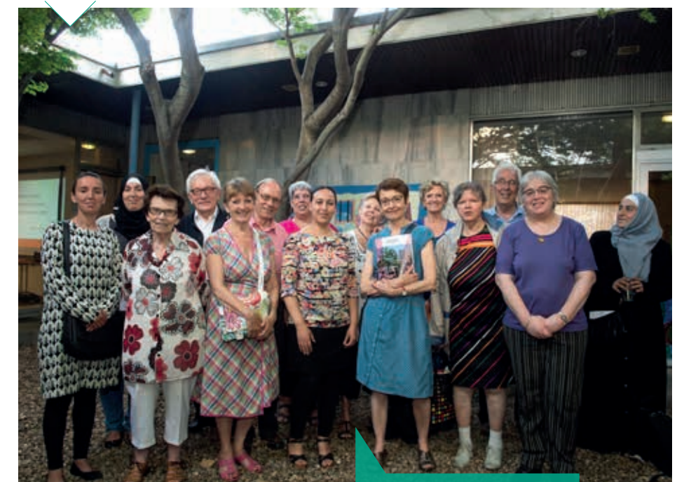
► Une partie du Conseil Citoyen de La Duchère

► Infos et contact : conseilcitoyen.duchere@gmail.com (ou auprès de la Mission Duchère : 04 37 49 74 00).